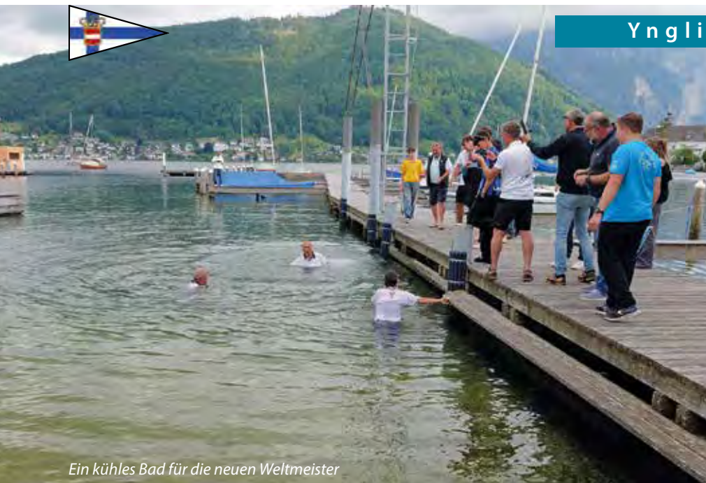
Ein kühles Bad für die neuen Weltmeister