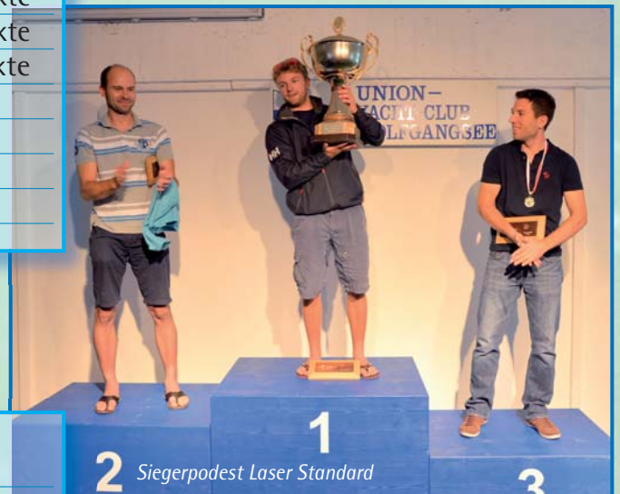
2 1 3 Siegerpodest Laser Standard