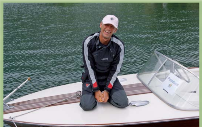
Pressebetreuer bei der Arbeit

Ihr Tischler macht's persönlich! Bojenstein-versenk- und-hebe-Maschine, angetrieben von einer Akku-Bohrmaschine.