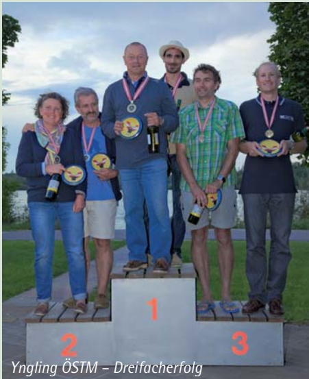
Yngling ÖSTM – Dreifacherfolg

Die Saison begann mit den Nord-amerikanischen Meisterschaften und Weltcup in Miami/USA im Jänner, ehe im Frühjahr die europäischen Klassiker in Palma de Mallorca (Spanien), Hyères (Frankreich) oder der Kieler Woche (Deutschland) folgten. Im Sommer segelten wir die Europameisterschaften vor Helsinki (Finnland). Bei all diesen Regatten erreichten wir TopTen-Tagesränge, vor allem bei Leichtwind konnten wir mit der Weltspitze mithalten.