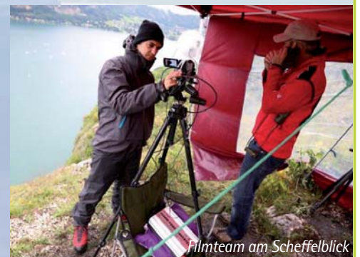
Filmteam am Scheffelblick

Sämtliche Bereichsleiter hatten eine Vielzahl an Helfern, ohne deren Engagement der Erfolg dieser Veranstaltung nicht möglich gewesen wäre. Herzlichen Dank an jede(n) Einzelne(n).