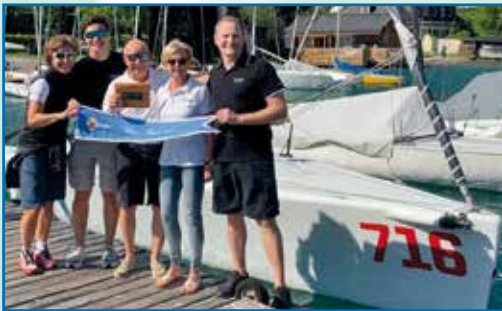
Sieger Blaues Band