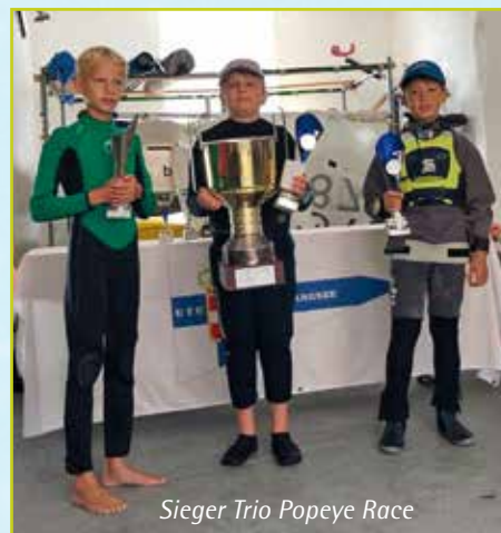
Sieger Trio Popeye Race