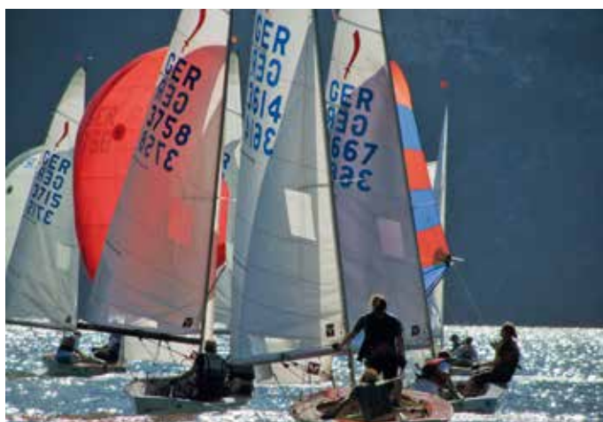
Die Korsar-Klasse segelt 2021 die ÖM am Wolfgangsee, nachdem diese heuer coronabedingt abgesagt werden musste