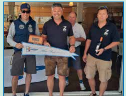
Sieger Weißes Band