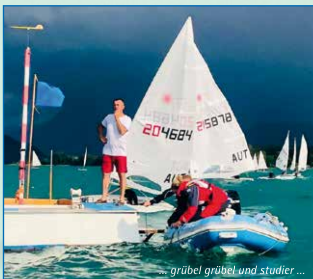
... grübel grübel und studier ...