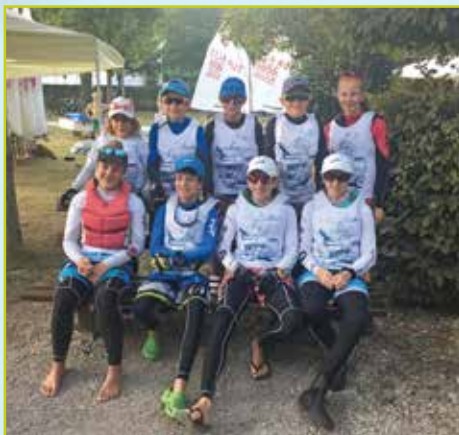
UYC Wg-Team Optimist