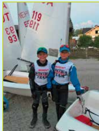
UYC Wg Team Zoom8