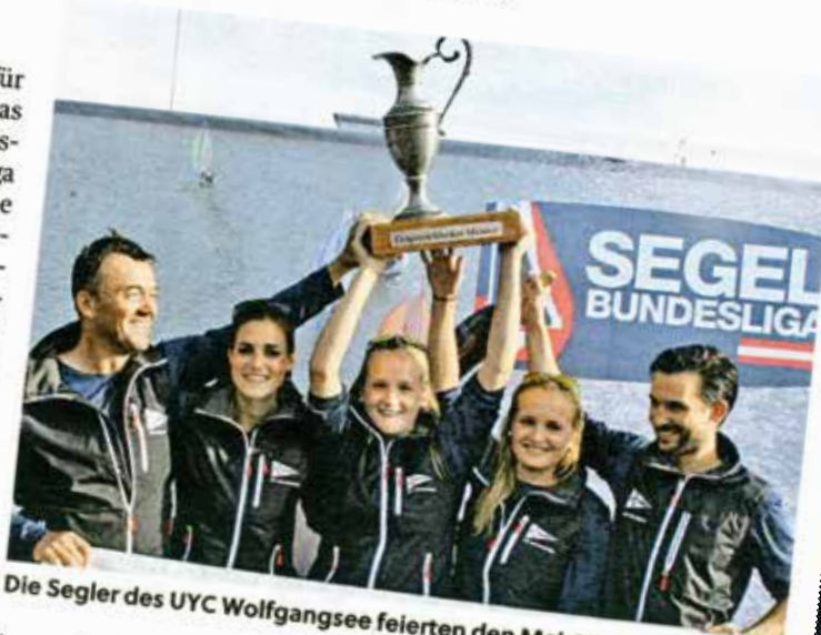
Die Segler des UYC Wolfgangsee feierten den Meistertitel.

„Wir sind extrem glücklich, die Bundesliga in der letzten Wettfahrt für uns entschieden zu haben. Wir haben vor dem Start in Match-Race-Manier Breiten-