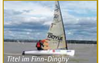
Titel im Finn-Dinghy