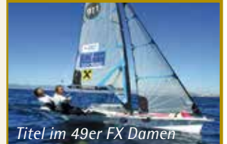
Titel im 49er FX Damen