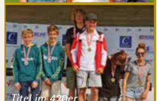
Titel im 420er