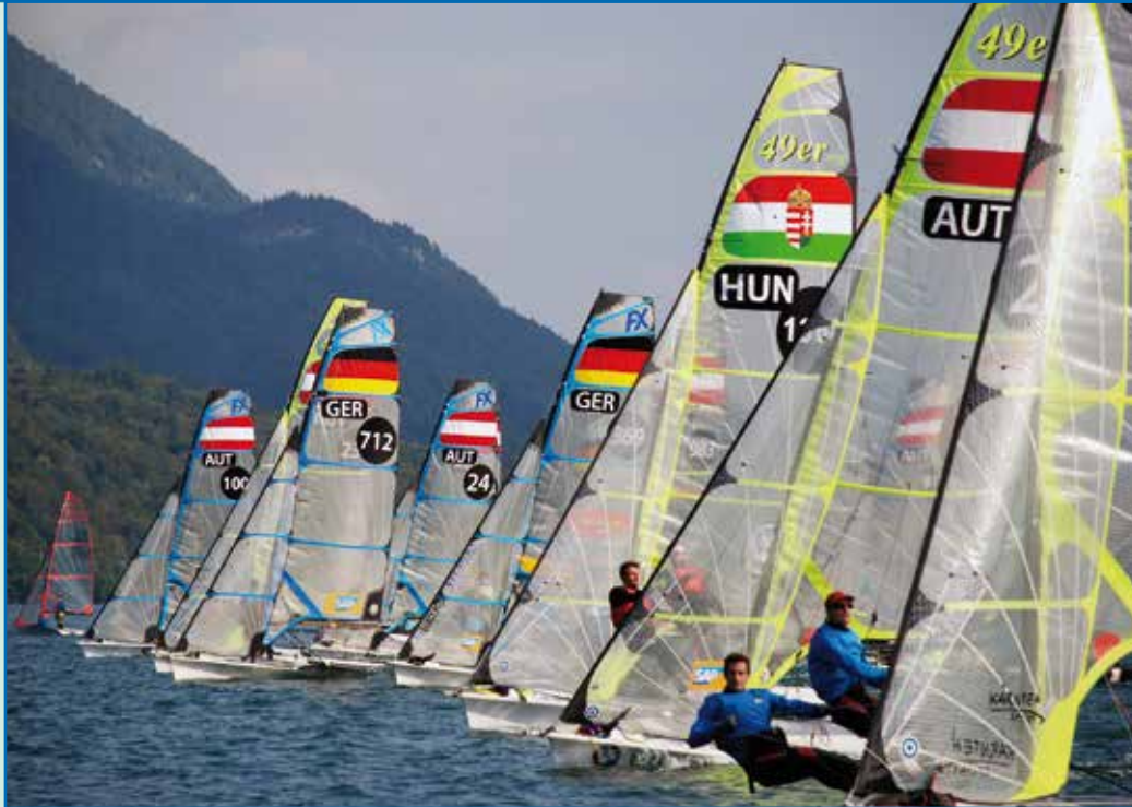
28 Boote aus GER, HUN, AUT