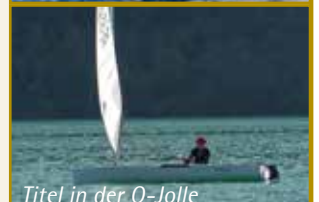
Titel in der O-Jolle