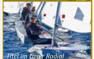
Titel im Laser Radial