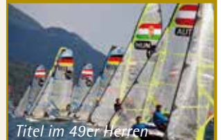
Titel im 49er Herren