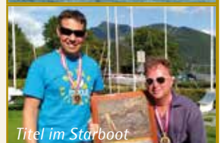
Titel im Starboot