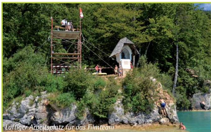
Luftiger Arbeitsplatz für das Filmteam