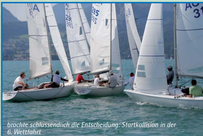
brachte schlussendlich die Entscheidung: Startkollision in der 6. Wettfahrt

24 Boote nahmen an diesen Meisterschaften teil.