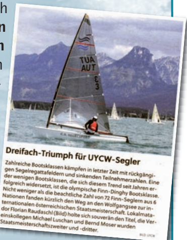
Dreifach-Triumph für UYCW-Segler