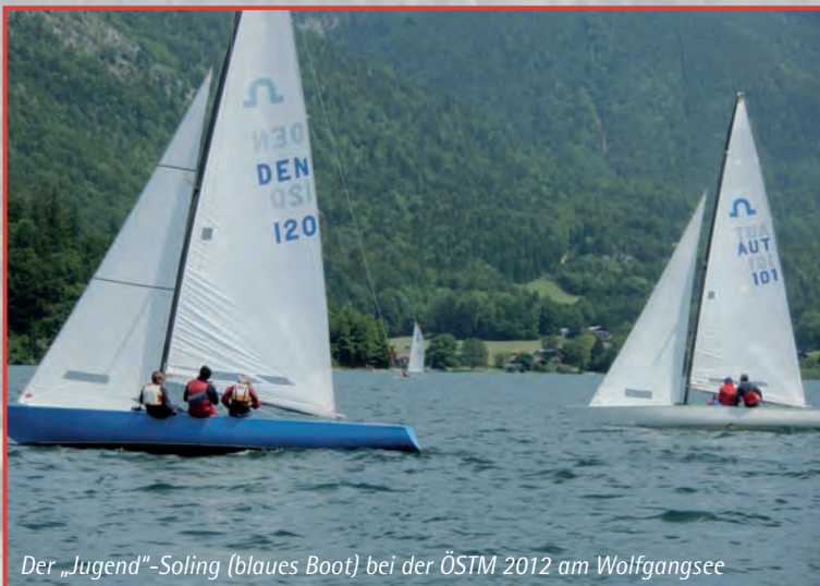
Der „Jugend“-Soling (blaues Boot) bei der ÖSTM 2012 am Wolfgangsee