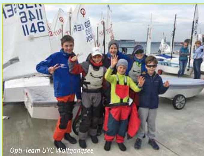
Opti-Team UYC Wolfgangsee