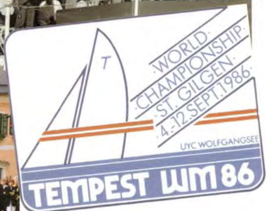
Grosse Eröffnungsfeier vor dem Rathaus St. Gilgen